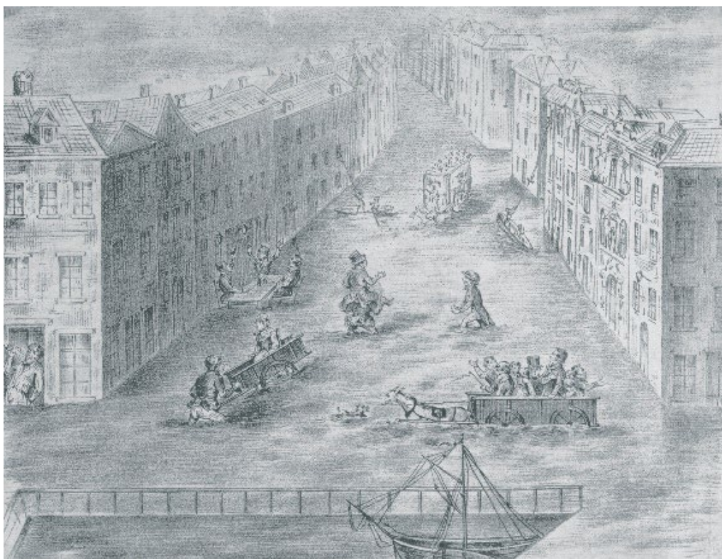
Anonyme, Inondation du Vieux Marché aux Grains , gravure, 1850

Une autre gravure, visible au Musée des Égouts, illustre l'inondation de 1850 à la Place du Vieux Marché aux Grains. À l'avant-plan on distingue le bassin Sainte-Catherine du port intérieur de Bruxelles. Il sera remblayé plus tard pour l'édification de l'actuelle église Sainte-Catherine.