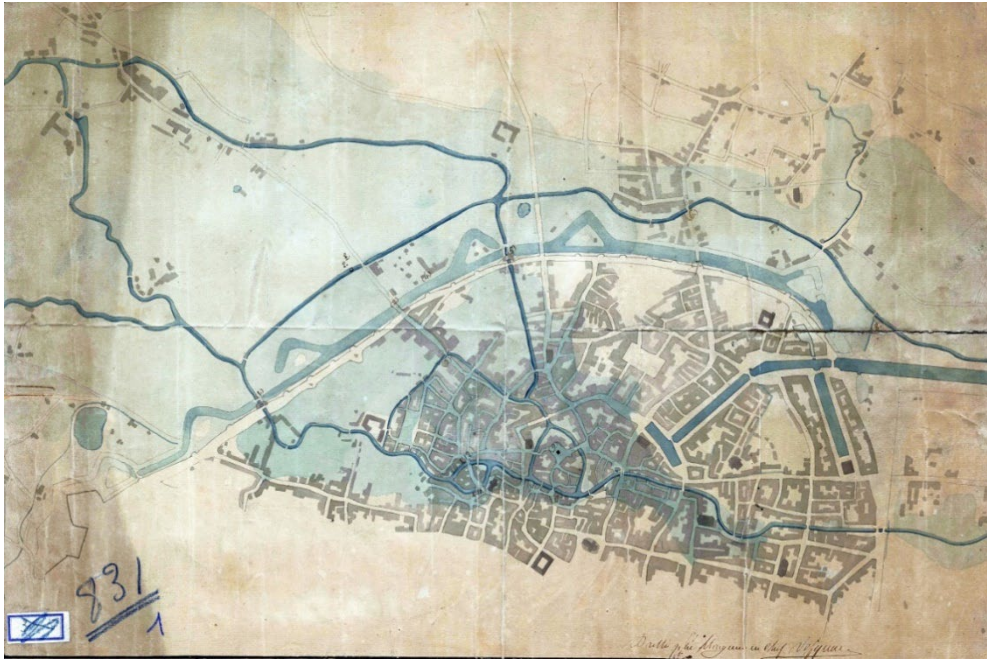
Jean-Baptiste Vifquain, Plan de l'inondation extraordinaire du 20 au 21 janvier 1820 , Dessin © Archives de la Ville de Bruxelles, Fonds administratifs Travaux Publics, PP 0831-01

Une autre gravure, visible au Musée des Égouts, illustre l'inondation de 1850 à la Place du Vieux Marché aux Grains. À l'avant-plan on distingue le bassin Sainte-Catherine du port intérieur de Bruxelles. Il sera remblayé plus tard pour l'édification de l'actuelle église Sainte-Catherine.