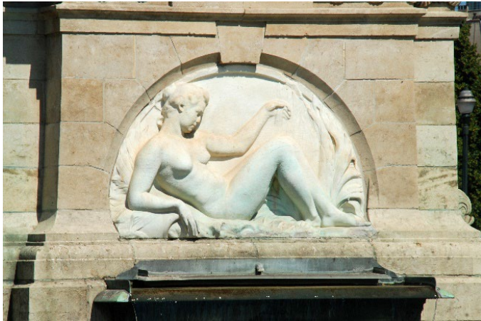
Martin Angenot, Détail de la fontaine Anspach , photographie, 2020

D'autres éléments marins et fantastiques, tels que chimères et coquillages participent à l'ornementation de la fontaine.