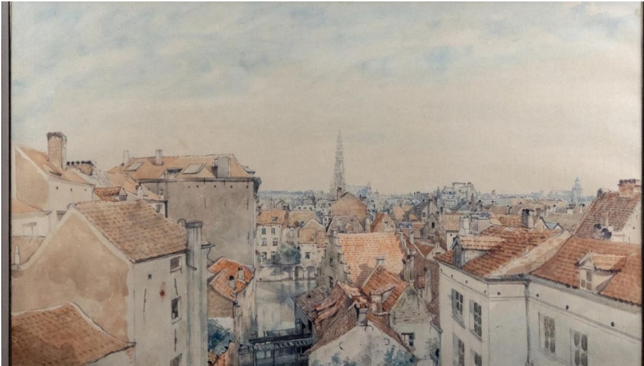
Jean-Baptiste Van Moer, Vue panoramique en direction de l'Hôtel de Ville de Bruxelles , dessin aquarellé, 1868 © Musées de la Ville de Bruxelles

Il est intéressant de confronter le point de vue de Van Moer à celui du photographe Ghémar.