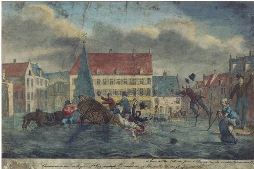
Frères Willaume, La place Saint-Géry inondée , lithographie, 1820

Sur l'illustration ci-dessus, on reconnaît la fontaine obélisque qui agrémentait une place de l'ancienne île Saint-Géry et qui est aujourd'hui toujours visible à l'intérieur des actuelles halles Saint-Géry. Les habitants du quartier représentés en train d'essayer d'échapper à l'inondation trouvent un écho dans le # Sauve qui peut.