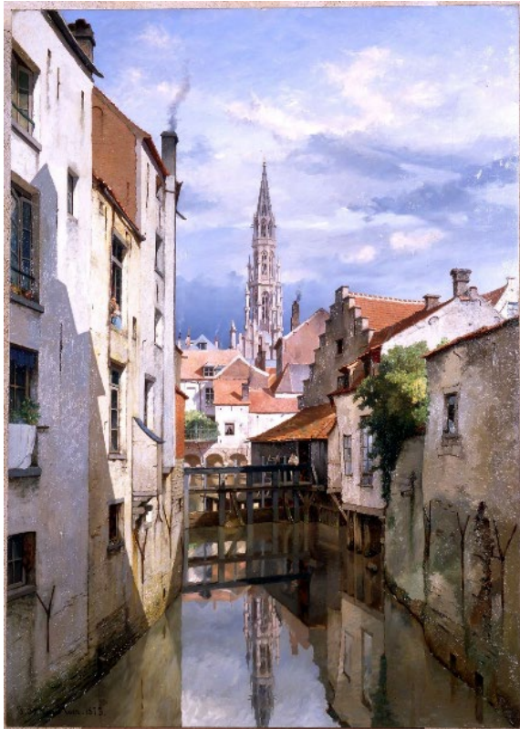
Jean-Baptiste Van Moer, Vue de la Senne et du Ruysmolen , huile sur toile, 1873

Au centre, on aperçoit le moulin à eau appelé Ruyschmolen. Au fond, on aperçoit l'estaminet de l'Ours reposant sur des arcades et la flèche de l'Hôtel de Ville.