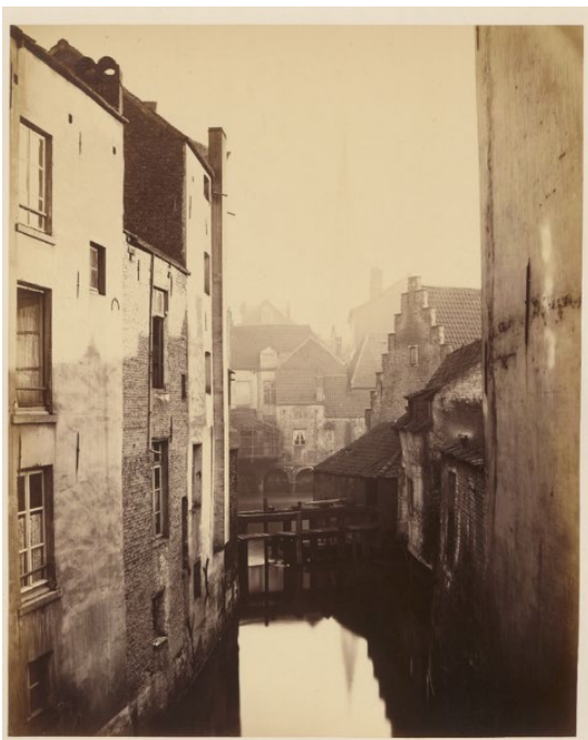
Louis-Joseph Ghémar, Vue de la Senne et du Ruyscmolen , dans Assainissement de la Senne. Bruxelles en 1867. Vues photographiques prises à l'emplacement du nouveau boulevard à ouvrir au travers de la Ville de Bruxelles par Ghémar Frères, pour la Belgian Public Works Company Limited

Il est intéressant de confronter le point de vue de Van Moer à celui du photographe Ghémar.