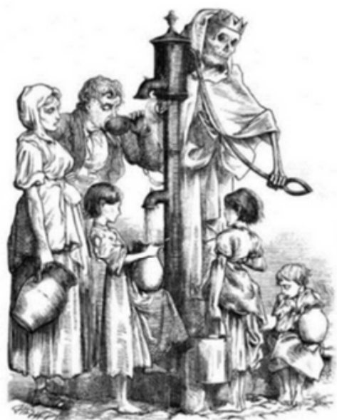
George Pinwell, Death's Dispensary , gravure, 1866

Ce # Beurk ça pue fait référence à la théorie des miasmes répandue à l'époque attribuant la cause des épidémies à l'air vicié ambiant. En réponse à cela, le courant de l'hygiénisme met en avant l'importance de la salubrité pour la santé humaine ; il milite pour faire entrer en ville l'air et la lumière en remplaçant les anciens quartiers jugés insalubres par de nouveaux desservis par de larges voiries aérées.